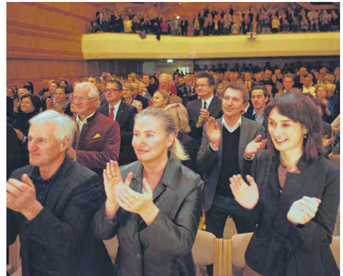
Beste Stimmung herrschte gestern Abend im bis auf den allerletzten Platz besetzten Angelika-Kaufmann-Saal.